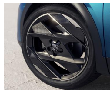
20" alufelger Monolithe matt sort Onyx

Valgt ekstraustyr kan erstatte utstyret oppgitt i oversikt over standardutstyr